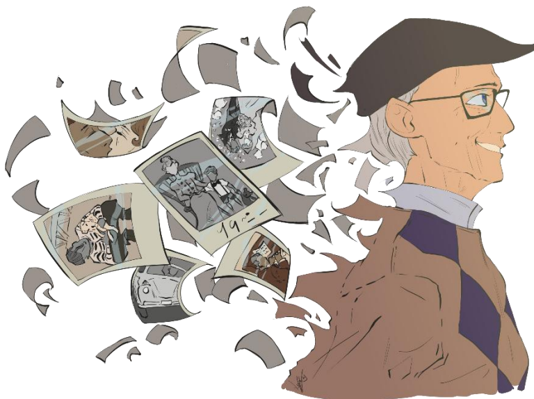
Fig.9.- Ilustración de Lucía Agüero Collado