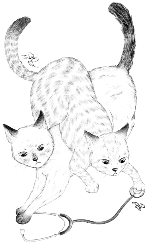
Fig. 8.- Ilustración de Jezabel Agüero Collado