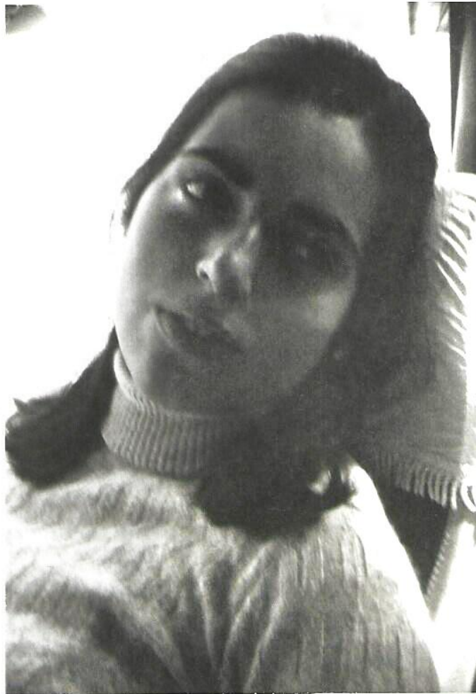
Fig. 13.- Foto cedida por Isabeleta Batlló compañera de clase en un viaje a Roma