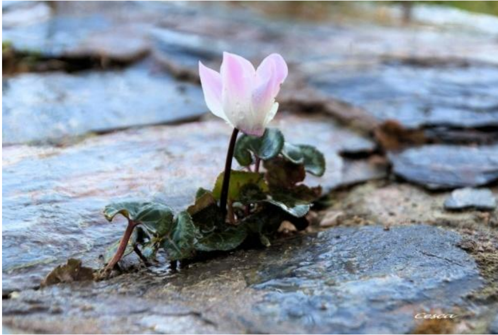
Fig.12 . Resilencia.