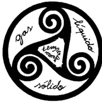
Fig.6. La rueda de los elementos. Creación del autor