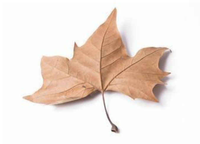
Fig. 2. Mirar