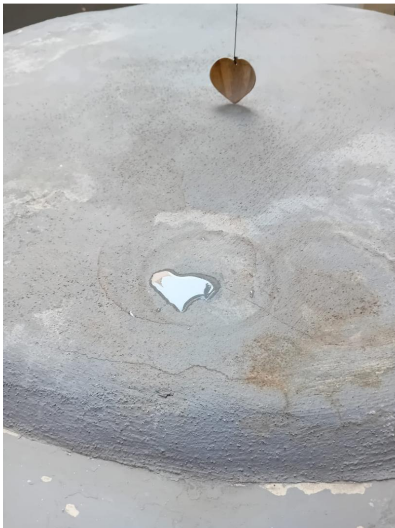
Fig.11.- Foto de María Isabel Collado Figueroa