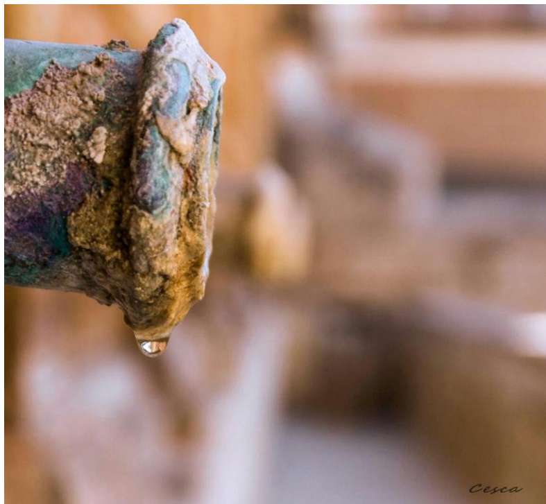
Fig.4. “Velahí” (ahí está).