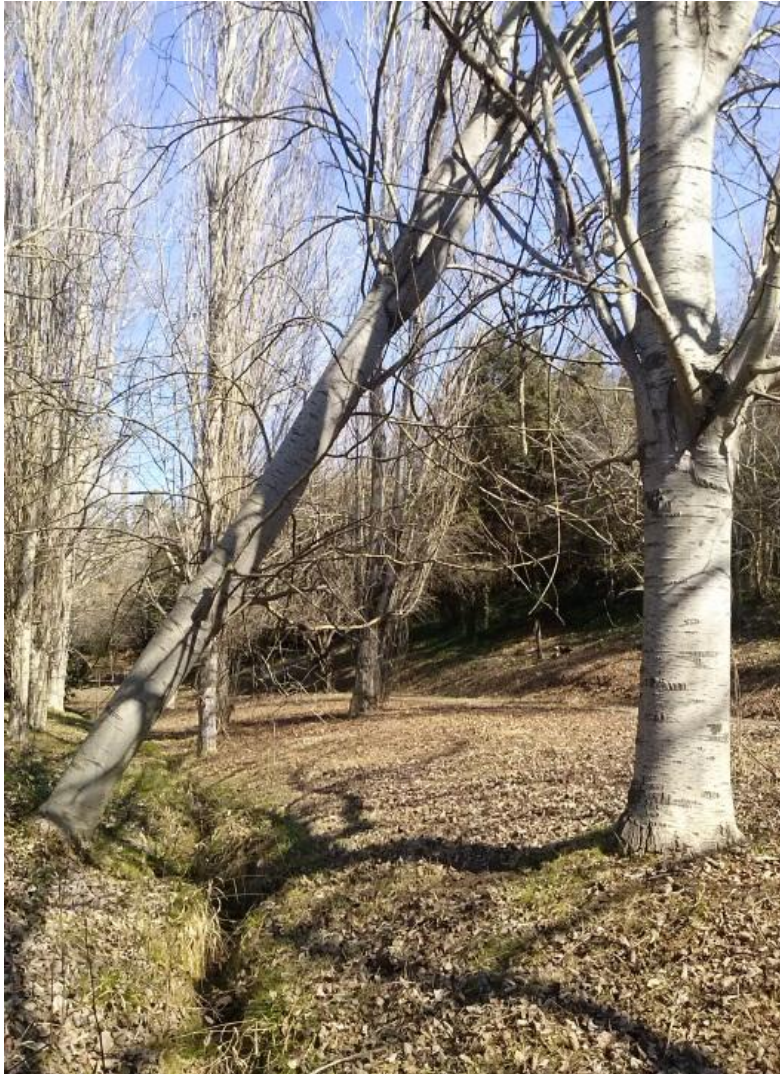
Fig.1. Torrente dels Alous (foto del autor)

Respiras hondo... ¿Quizás los árboles también sienten amor? ... ¿Y tú? ...sigues corriendo y ves algunos árboles tendidos en el suelo... ¿Acaso no hayan encontrado su amor?