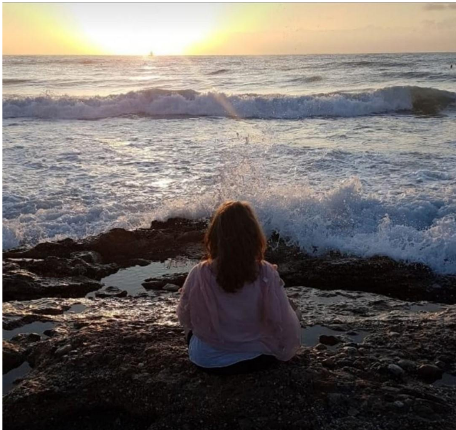
Fig.10.- Foto Lucía Agüero Collado