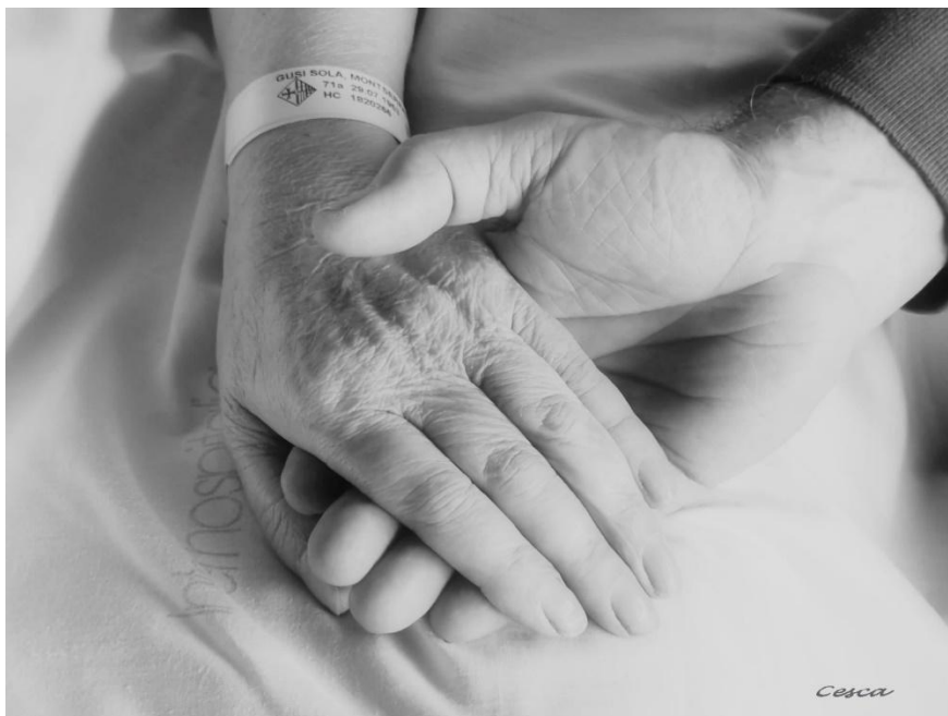
Fig.14.- Manos.